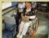
ノンステップバスの利用

平和台バス停(終点)から長い上り坂。いっしょうけんめい車いすを押して平和台公園へ。10分ほどで到着。