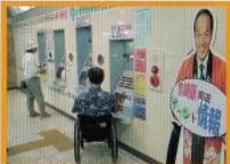
券売機～車いすで購入可。赤字表示あり。誘導ブロックで誘導しています。

駅周辺には、バス停留所、レンタカーの店舗などがあります。宮崎の観光のことは1Fの宮崎市観光案内所(TEL0985-22-6469)でお尋ねください。