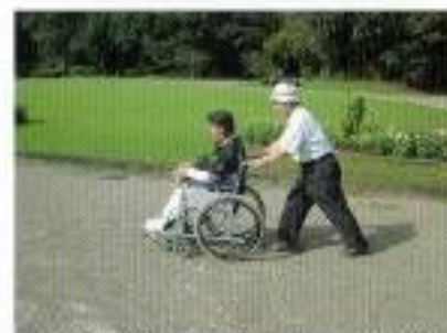
園内は砂利敷きのため車いすの場合は介助者がいると安心です。