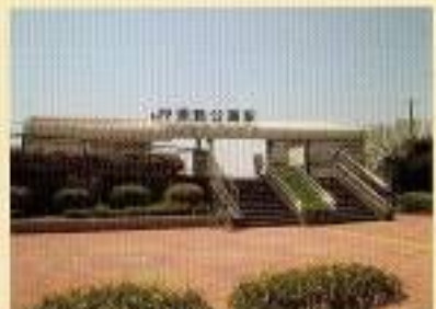
運動公園駅(無人駅)