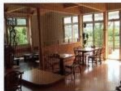
ウンジョールノ店内

駐車場を区分して道路から建物入り口に向かって歩道が確保され、点字ブロックが敷かれています。