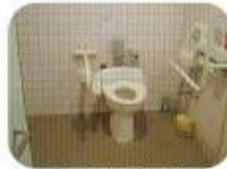
車いす対応トイレ