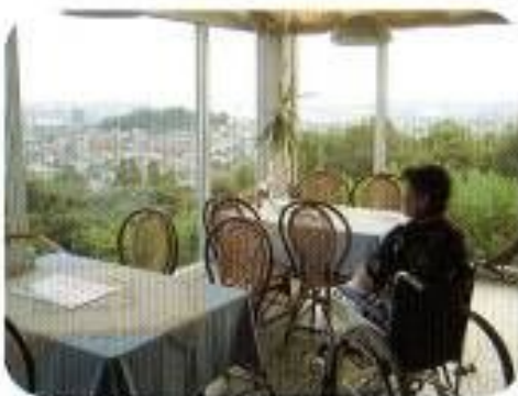
宮崎市街を一望できるロケーションです。