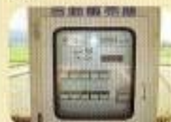
券売機(購入できない区 間があります)～車いす から届く高さです。