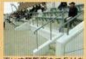
車いす観覧席までEVを利用して行けます。