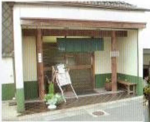
アンジュール入口