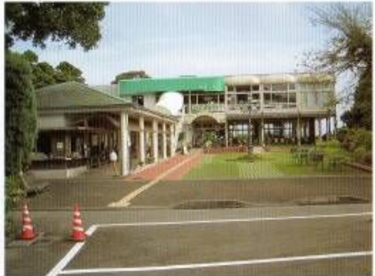
第1駐車場から建物出入口までの点字ブロックによる誘導があり、段差なく入れます。

http://www.heiwadai-bunkakoen.info/1_heiwadai_park/hiwada_fram.htm