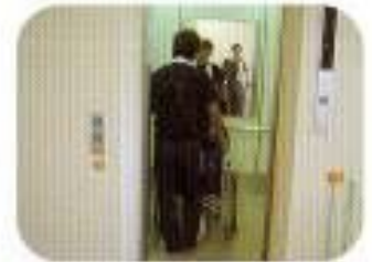
障害者対応エレベーター