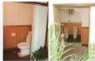
車いす対応トイレ