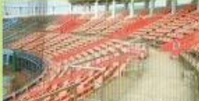
アイビススタジアムの車いす用観覧席