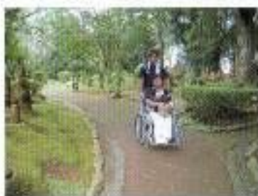
はにわ園は急勾配の坂道や幅の狭いところがあり、車いすの場合は介助者が必要です。