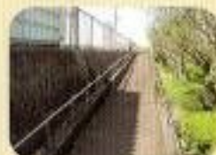
駅にはスロープがあり ます。

http://m-bfree.pref.miyazaki.lg.jp/bin/s?F=D&C=457