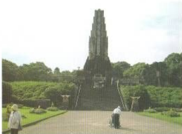
平和台公園のシンボル高さ37mの「平和の塔」は、皇紀2600年を記念して昭和15年に建設されました。塔へは階段のみで車いすで上ることはできません。