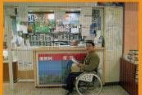
1Fに観光案内所があります。