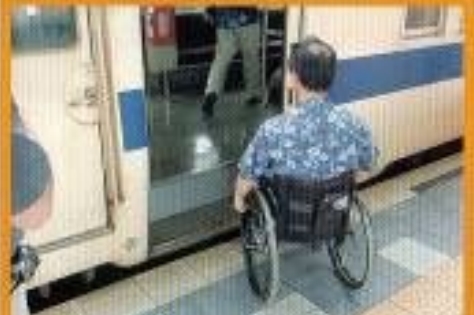
乗車の際は駅員に介助を申し入れてください。スロープを使い介助します。また行き先の駅まで連絡をとってください。