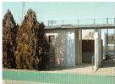
公衆トイレは男女別に車いす対応トイレ(ベビーシート有り)を設置