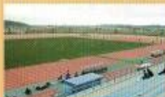
陸上競技場グラウンド