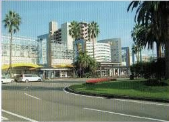
宮崎駅 高架駅です。