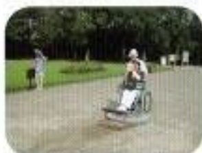
塔の手前に「反響石」があり、この石に乗って手を叩くと、「ビーン」って音がします。