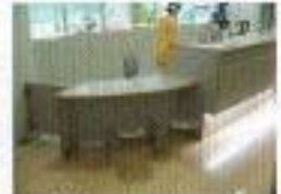
案内所ロウカウンター

多目的トイレにはオストメイト用水洗器具や介護用シート、ベビーシート、更衣台などを設置