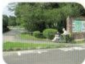
第1駐車場(障害者用駐車スペース2台あり)からスロープを上がり平和の塔前広場へ。