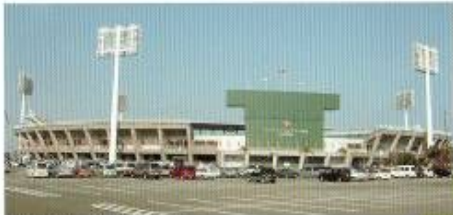
サンマリンスタージアム宮崎