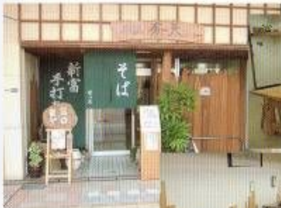
有一天入口(自動ドア)