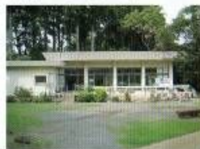
はにわ館の出入口前にはスロープがあります。