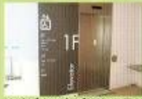
アイビススタジアムのEV