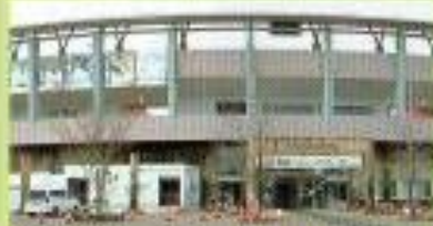
ソフトバンクホークスがキャンプするアイビススタジアム