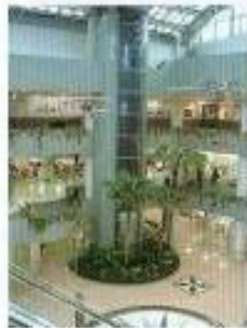
障害者対応エレベーター