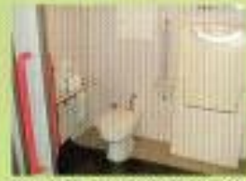
アイビススタジアムの多目的トイレ(男女別)