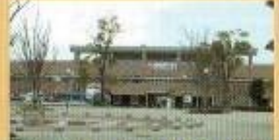
Jリーグがキャンプする陸上競技場