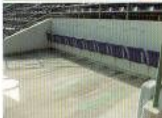
スタジアム内のエレベーターと 車いす用観覧席