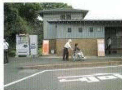
第1駐車場の公衆トイレには男女別に車いす対応トイレがあります。

展示室では、公園内の自然などが紹介されています。車いす対応トイレは男女別にあります。