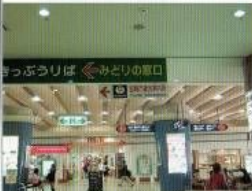
宮崎駅の構内には飲食店街があり、ほとんどのお店には段差なく入れます。

多目的トイレ内便器に子供用便座が付いています。ベビーシートや子供用小便器が設置されています。