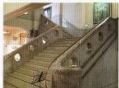
県庁本館の重厚な趣のある階段