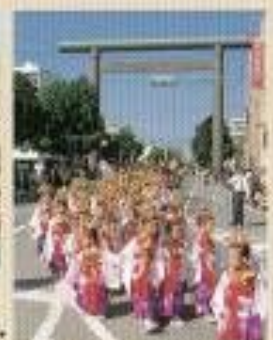
↑神宮大祭のシャンシャン馬とお稚児さん行列