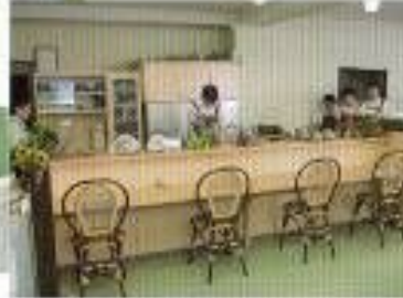
アンジュール 店内