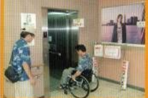
上りと下りのホームとも障害者対応エレベーターがあります。