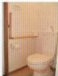
車いす対応トイレ